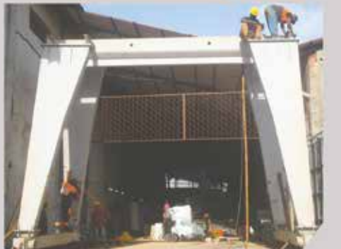
Montage de Palan, Menema