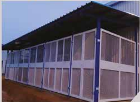
Hangar Conakry Terminal