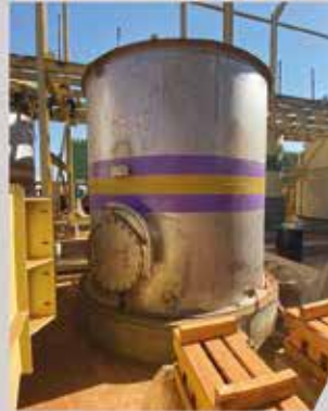
Cuve INOX - SENET