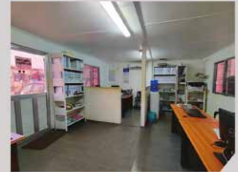
BUREAU 40' INTERIEUR