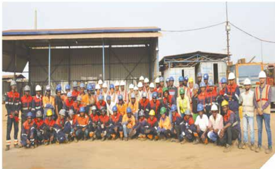
L'équipe d' ATC GUINEE

-Direction Technique et Bureau d'Etude -Direction commerciale -Direction financière -Direction de la Production -Service qualité – mise en œuvre norme ISO -Hygiène, sécurité et environnement -Achats, gestions des stocks -Ressources humaines