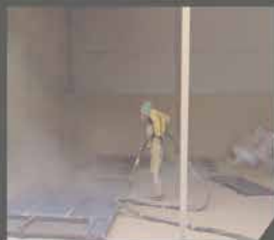
Zone de Sablage