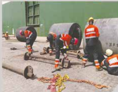
Réhabilitation de Quai, Conakry Terminal