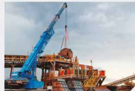
Installation de chute - DTP MINING