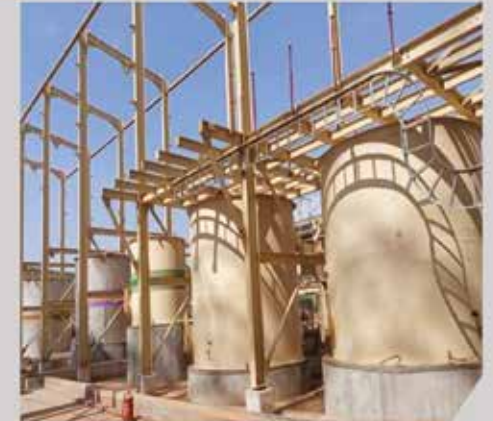
Cuve de stockage - SENET