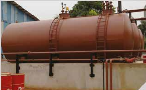
Réservoirs carburant APS