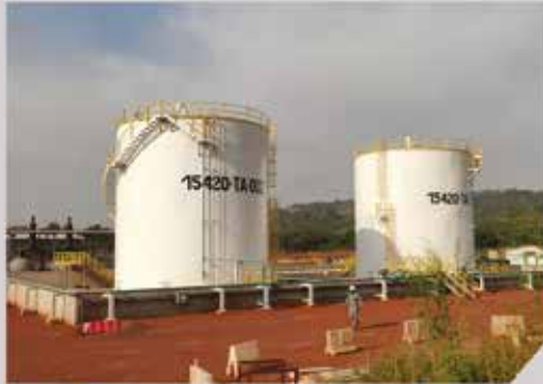
CUVE 1000 m 3 - GAC/VIVO ENERGY