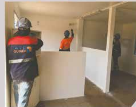
Peinture de bureau