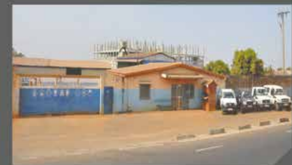
Siège ATC Guinée