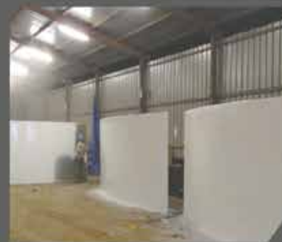
Zone de Peinture