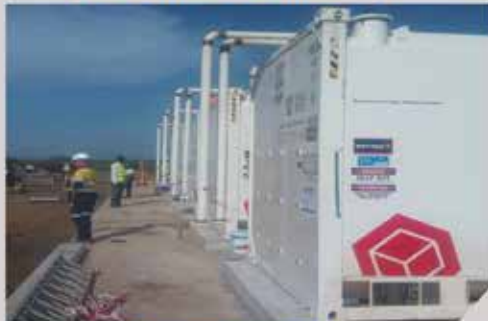
GAC Port - SBT PIPING