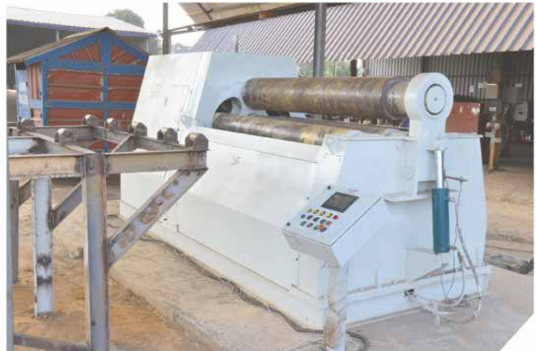
Machine de roulage hydraulique avec 4-rouleaux