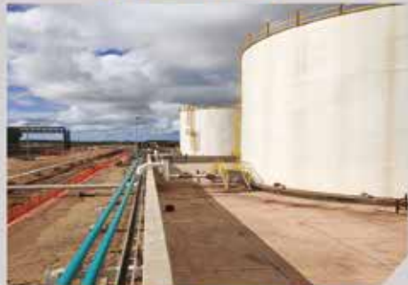
CUVE 3000 m 3 - GAC/VIVO ENERGY