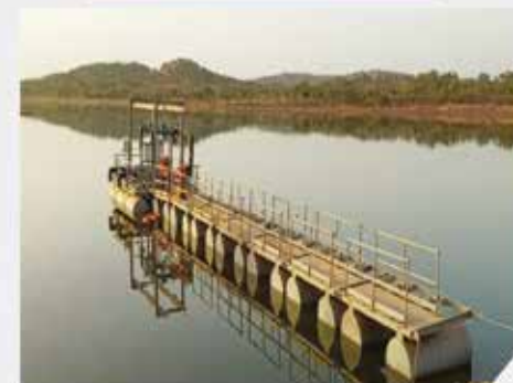
Barge Flottant - BCM