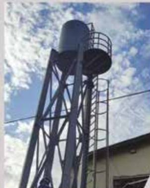
Cuve D'eau - TOP Guinee