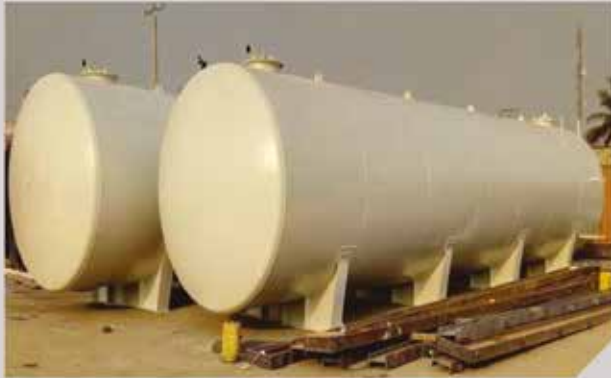
Cuve 100m3 - GMC