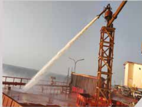
VIVO - Fire Fighting