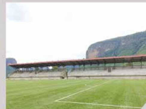
Tribune de Stade - AFAS