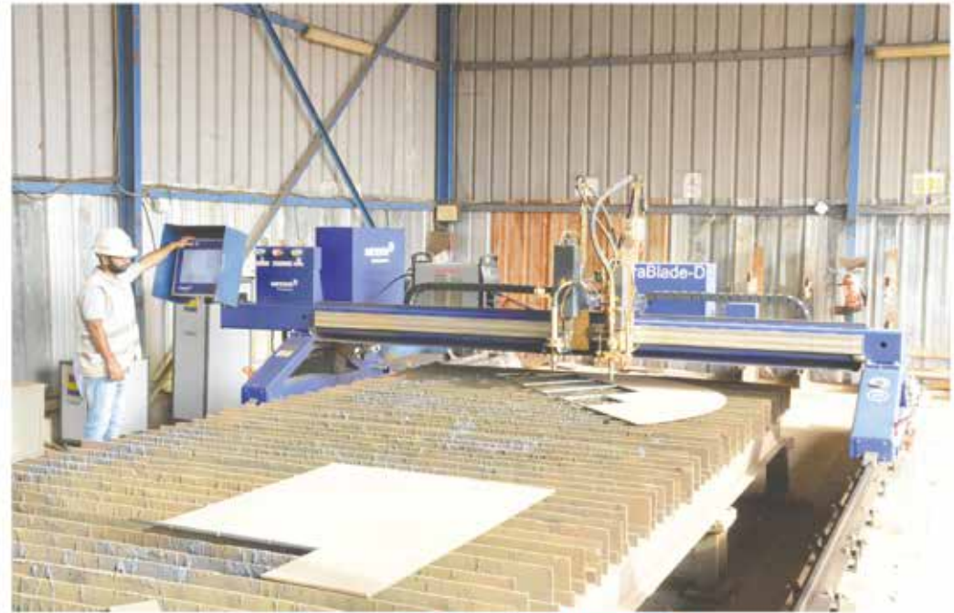
Messer plasma / Oxy-Acetylene Cutting Machine (CNC)