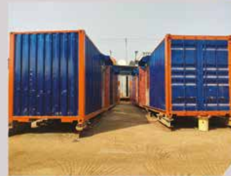
LOGEMENT 40' - MANAGEMENT