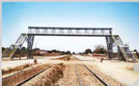
CBG (Pont piéton)

- Le boulonnage, quant à lui, trouve son application dans les montages sur site. Les éléments découpés sont confectionnés dans nos ateliers pour être assemblés sur site.