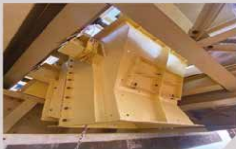
Chute - SENET