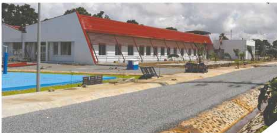
Bluezone Dixinn (Pont Kenen)

Notre bureau d'études étudie tous les dossiers et mène à bien, selon les besoins, conception, définition des matériaux et des procédés, dimensionnement, émission de note de calcul, mise en plan, etc. C'est à l'issue de cette analyse préliminaire que se fait la définition du délai et l'élaboration du planning prévisionnel.