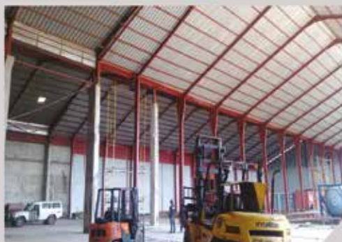
Mezzanine - BESTPLAST