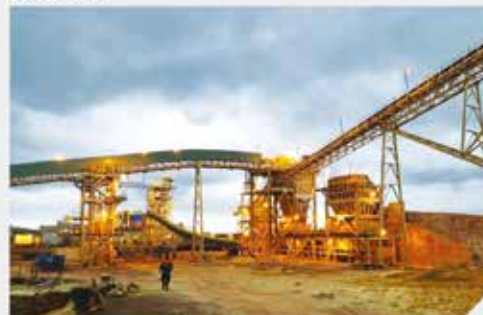
Mine D'Or - SENET_SMM

Afin de répondre en temps réel à toutes sollicitations de ses clients miniers, ATC GUINÉE dispose de bases sur différents sites miniers qu'il sert. Chaque base est composée d'une équipe d'ouvriers très qualifiés, de matériels adéquats et d'un parc automobile.