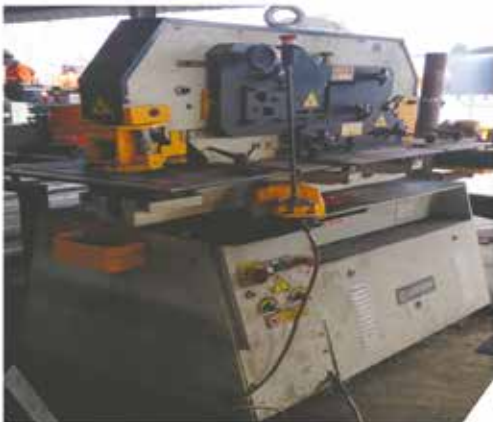
Poinçonneuse / Découpeuse hydraulique (Iron Worker)