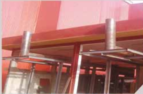
Supports pour l'échappement, GMC