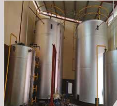
Cuve de Gasoil - TOPAZ