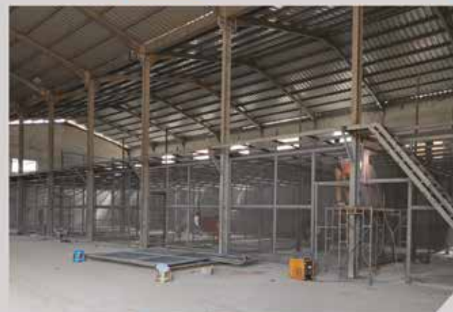
Mezzanine - BESTPLAST