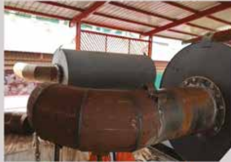
Installation d'échappement - TOPAZ