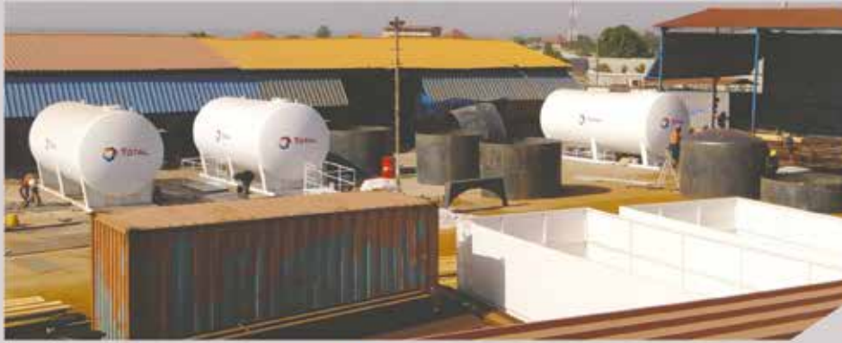
Réservoirs carburant TOTAL

ATC GUINEE est spécialisé dans la fabrication de tout type de cuves métalliques