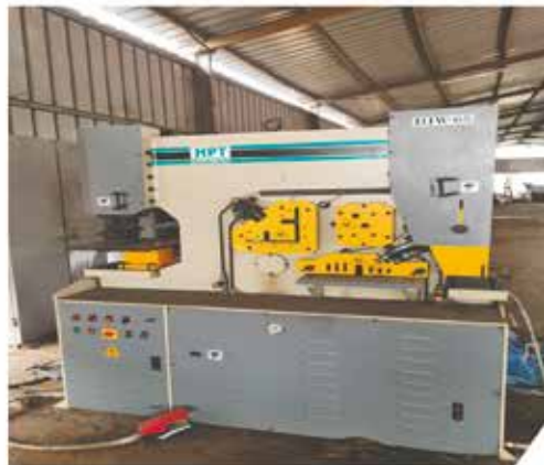
Poinçonneuse / Découpeuse hydraulique (Iron Worker)