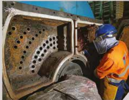
Chaudronnerie - Sheraton Hotel