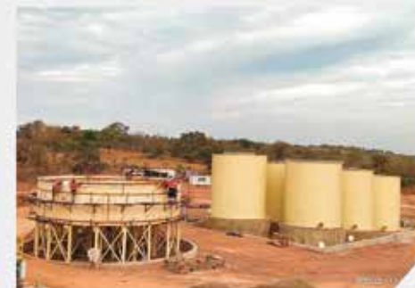
CIL Cuves & NZ Thickener - PPM