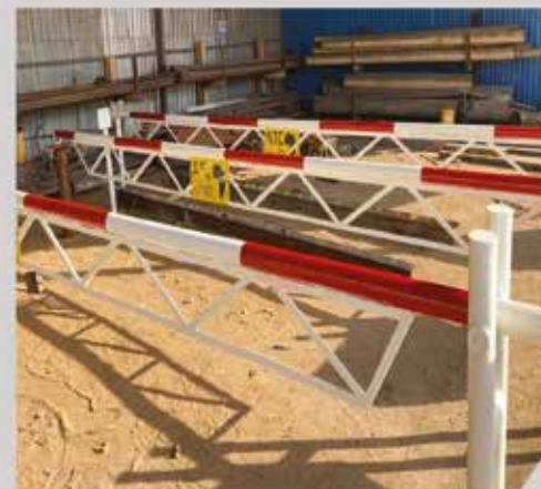
Barrière - BATA Guinée