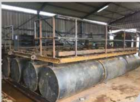
Barge Flottant - BCM