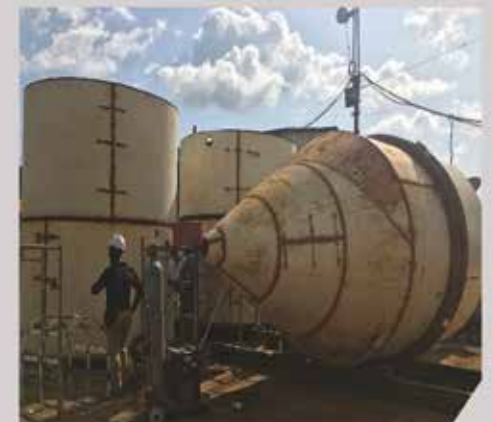
Cuve Conique - SENET