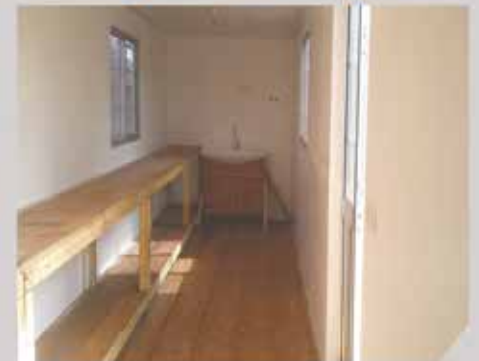
Laboratoire biologique, SOGEA-SATOM