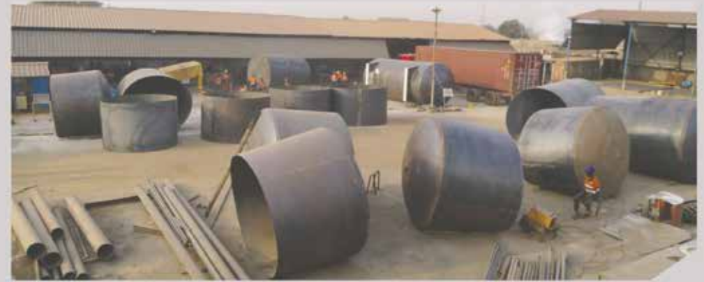
Fabrication de Cuves